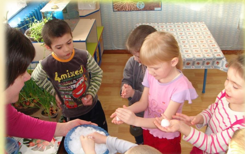
Эксперименты со снегом и льдом