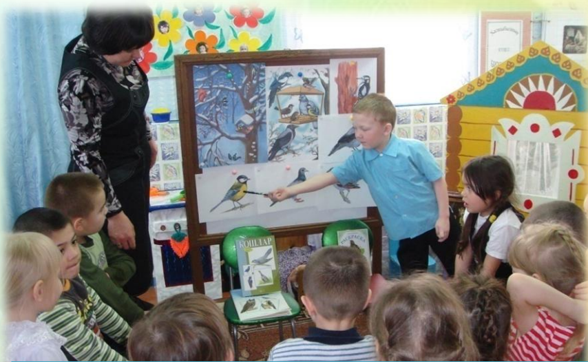
Беседы о животных и зимующих птицах