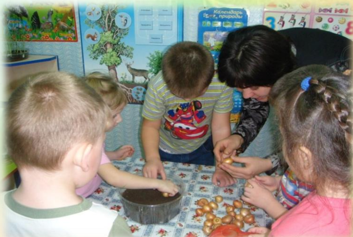
Выращиваем зелёный лук